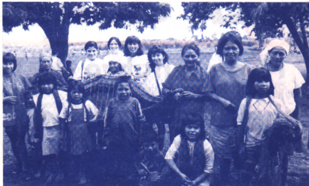
Ao visitar a Missão Tapeporã, em 1996, metodistas e o povo Kaiowá-Guarani teceram uma rede de amor e solidariedade

F oi fazendo uma grande rede de amor e solidariedade que, em 1996, conseguimos fazer da nossa "Vigília Nacional pela Criança" um esforço conjunto para orar, celebrar e contribuir com recursos financeiros para a Missão Metodista Tapeporã, desenvolvida com os índios Kaiowá-Guarani, em Dourados (MS).