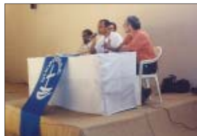
"IV Fórum Social Mundial", Índia, 2004 – Painel contra a intolerância religiosa "IV World Social Forum", India, 2004 – Panel against religious intolerance

The anti-Davos Economic Forum network, as is widely known, has acquired weight and relevance in the world scenario as a space for networking hopes to build a new world, to challenge the single model and the morbid single neoliberal solution for the fate of the planet. Much more than a Social Forum against the Economic Forum , the WSF has brought together fuzzy and disperse dynamics of reconstructing the oikoumene on new bases, which start from concepts of radical democracy, participation, and dialogue among the civil societies of the world and between them and their States. The encounter of WSF participants with mainstream planet themes, with networks of networks, of the most diverse movements that share common purposes but are