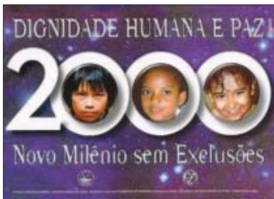
"Campanha da Fraternidade Ecumênica", 2000 "Campaign for Ecumenical Fraternity", 2000

mobilizou as Igrejas cristãs em defesa da dignidade humana. Envolveu a responsabilidade das Igrejas comprometidas com o Movimento Ecumênico e com a causa da unidade visível da Igreja de Jesus Cristo. As Igrejas do Conic que juntas realizaram a CF-2000 Ecumênica, convidaram todos os cristãos a dela participarem, em comunhão de Serviço e de Missão.