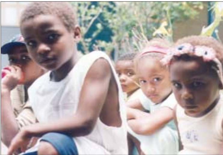
Crianças em comunidade negra rural brasileira, 2005 Children in a Brazilian rural black community, 2005

dessa própria espécie. Além disso, as relações sociais capitalistas de produção têm construído uma cultura de massa egoísta e consumista. O dilema que se apresenta é: dobramo-nos ao egoísmo e ao consumismo ou esforçamo-nos para realizar ações solidárias e de cuidado com a biodiversidade? As tradições religiosas afirmam a solidariedade com a biodiversidade como o caminho de salvação; isto nos ajuda a perceber que a própria afirmação dos direitos culturais e ambientais depende dessa noção escatológica, que responde ao nosso destino comum, e soteriológica, que responde à ação graciosa da Divindade. Daí o imperativo ético da condenação da antívida, que são o consumismo e o egoísmo.