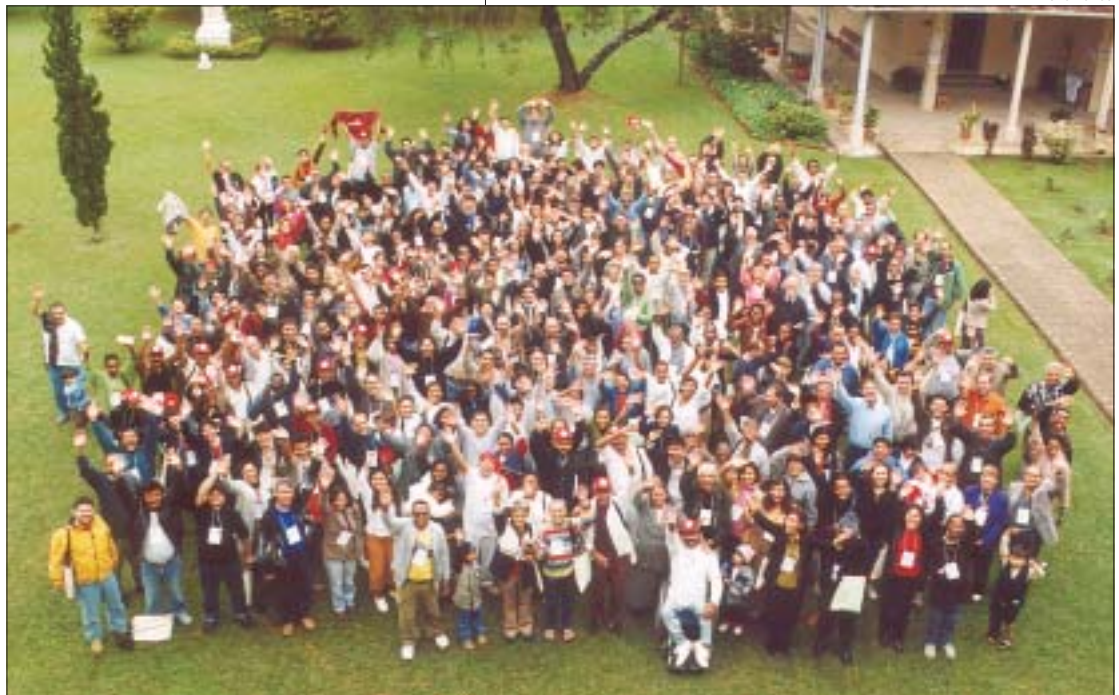
“2ª Jornada Ecumênica” “2nd Ecumenical Gathering”