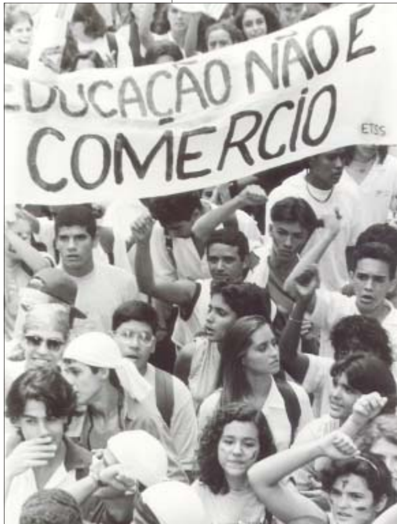
Passeata da União Nacional dos Estudantes, Rio de Janeiro, 2003 National Students Union demonstration, Rio de Janeiro, 2003

da Paz. A comunidade ecumênica denuncia isso, e assume o imperativo ético da afirmação da fraternidade entre as diferentes crenças religiosas e a condenação da intolerância religiosa.