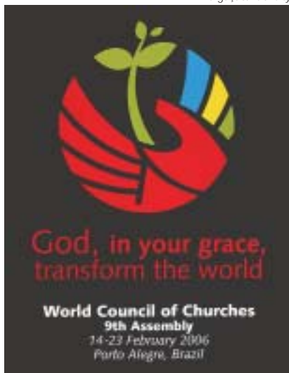
9ª Assembléia do CMI WCC 9th Assembly