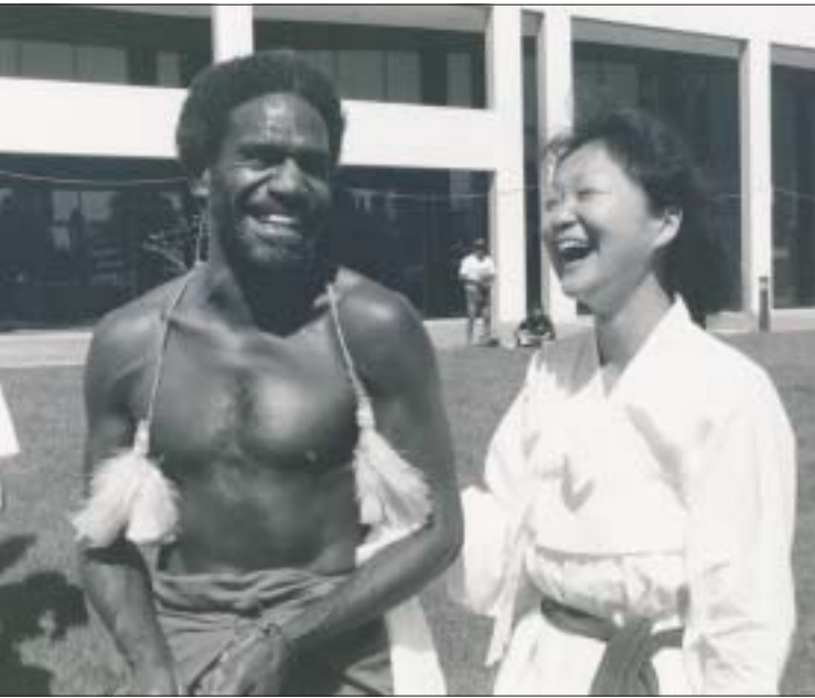
Participantes da Assembléia do CMI, Camberra, 1991 Participants in the WCC Assembly, Canberra, 1991

Ao estabelecer condições para a implementação desse diálogo, o hoje Fórum Ecumênico Brasil (FE-Brasil), consolidou um pacto de cooperação entre as Igrejas e os Organismos Ecumênicos que, infelizmente, por não ter sido alcançado no passado, causou um enorme dano ao desenvolvimento do movimento ecumênico no país. Isto se refere, especialmente, a algumas Igrejas Evangélicas brasileiras que permaneceram carentes dos insumos necessários, os quais não só as teriam auxiliado a romper com seu isolamento, como as teriam ajudado a superar o anticatolicismo herdado do esforço missionário do século XIX. Ao expressarem, no âmbito do então CER-Brasil, esta vontade de buscar um caminho comum, em nome do Evangelho e em favor do povo brasileiro, as Igrejas e os Organismos Ecumênicos estabeleceram novas bases de cooperação fundamentados num princípio de realidade que proclama que somente irmanados poderão construir um campo ecumênico com relevância sociopolítica e eclesial no contexto nacional. E, assim, oferecer um testemunho plausível do significado do Compartilhar Ecumênico de Recursos como um sinal concreto da contribuição dos valores evangélicos para a promoção da dignidade humana e sustentação da vida.