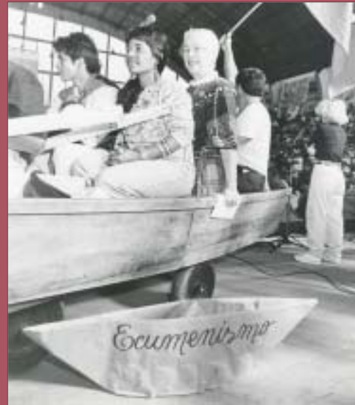
"VIII Intereclesial de CEBs", Brasil, 1992 "VIII National Meeting of Christian Base Communities", Brazil, 1992

O combate pela oikoumene é um ato de fé. Seu futuro imediato se define em sua própria práxis. Seu futuro último é somente a verdadeira oikoumene onde mora a justiça. Na tensão entre ambas se inscreve nosso ecumenismo em toda a sua ambigüidade e promessa.