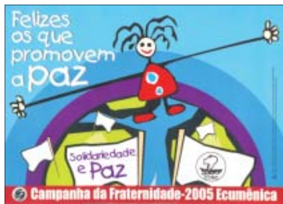
"Campanha da Fraternidade Ecumênica", 2005 "Campaign for Ecumenical Fraternity", 2005

Cabe uma nota introdutória aos eventos de mobilização, assim pensados pelo FE-Brasil. Trata-se de oportunidades em que o envolvimento orgânico do conjunto de entidades do Fórum se mobiliza para a sua realização, e em que o testemunho que se busca dar está