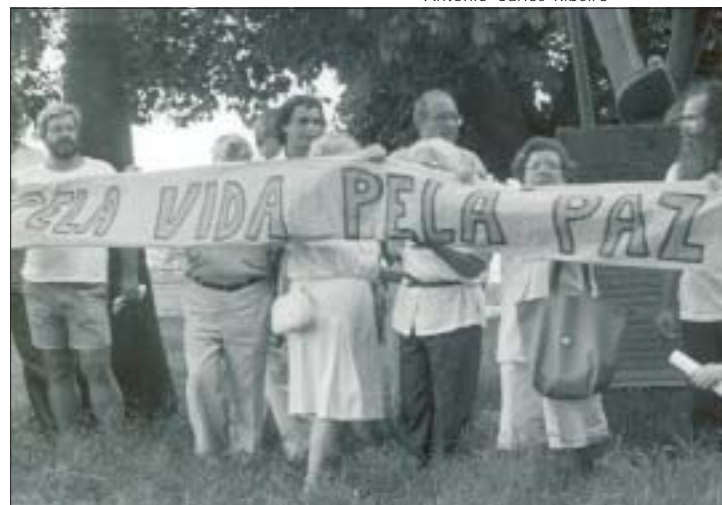
Manifestação ecumênica pela paz, Rio de Janeiro, 2002 Ecumenical demonstration for peace, Rio de Janeiro, 2002