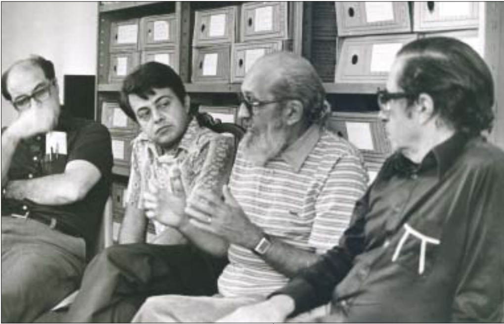
Paulo Freire retorna ao Brasil. Diálogo ecumênico, 1981 Paulo Freire returns to Brazil. Ecumenical dialogue, 1981

enquanto testemunha do Reino inaugurado por Jesus de Nazaré.