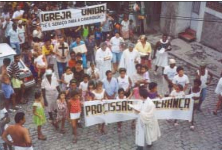
Mobilização contra a fome em favela do Rio de Janeiro, 1995 Demonstration against hunger in a slum in Rio de Janeiro, 1995

Instituição, no sentido do serviço, instrumento, veículo. Isto significa fortalecer uma proposta de Diálogo – de parcerias –, de derrubada de muros e de animar a caminhada conjunta em favor da VIDA. Nesse sentido, torna-se fundamental trabalhar a relação ecumênica de forma diversificada e graduada; juntar-se a todas as pessoas de boa vontade e celebrar para unilas na defesa da vontade de Deus Criador. Os imperativos de justiça-paz-respeito à vida-liberdade religiosa-sobrevivência da humanidade não permitem a confessionalização, a dogmatização e a atomização da estruturas religiosas. Isto é um compromisso ético de diaconia.