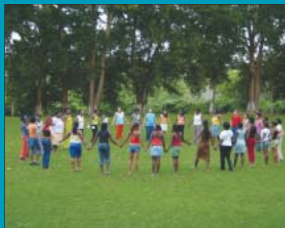
Mulheres negras, Sapê do Norte, Brasil, 1994 Black woman, Sapê do Norte, Brazil, 1994

Dentre tantas, destacamos, neste capítulo, aquelas ações que dão visibilidade à afirmação dos Direitos Humanos (DHESC-A) e da Paz, em 2005 e 2006.