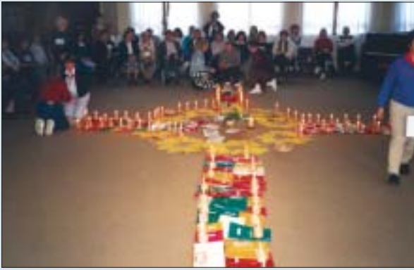
"Seminário Nacional da Terceira Idade", IECLB, 1997 "Edrely National Meeting", IECLB, 1997

O FE-Brasil tem por consenso que na raiz de toda violência está um direito violado e que a construção da paz só pode se dar na promoção de direitos. Assim, agrupamos as diferentes ações da diversidade do FE-Brasil pela explicitação positiva de cada afirmação particular de direitos, a saber: