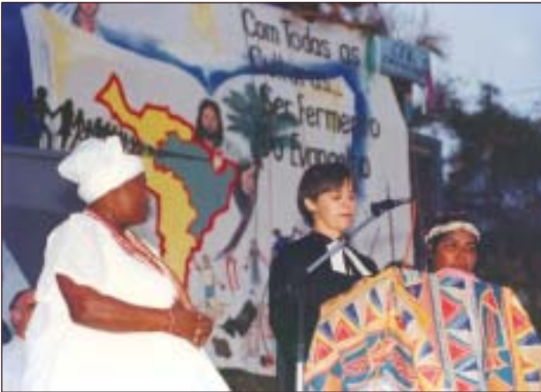
"VIII Intereclesial de CEBs", Brazil, 1992 "VIII National Meeting of Christian Base Communities" Brazil, 1992