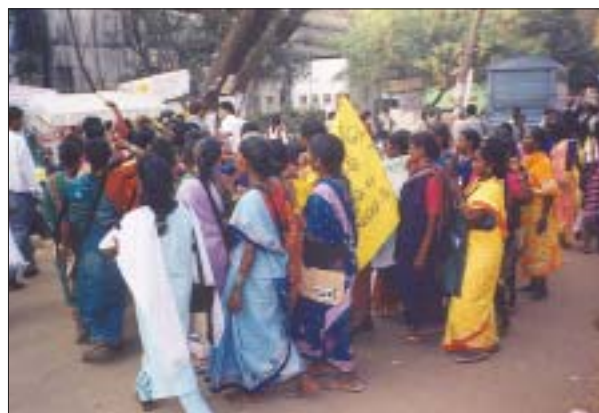
“IV Fórum Social Mundial”, Índia, 2004 “IV World Social Forum”, India, 2004