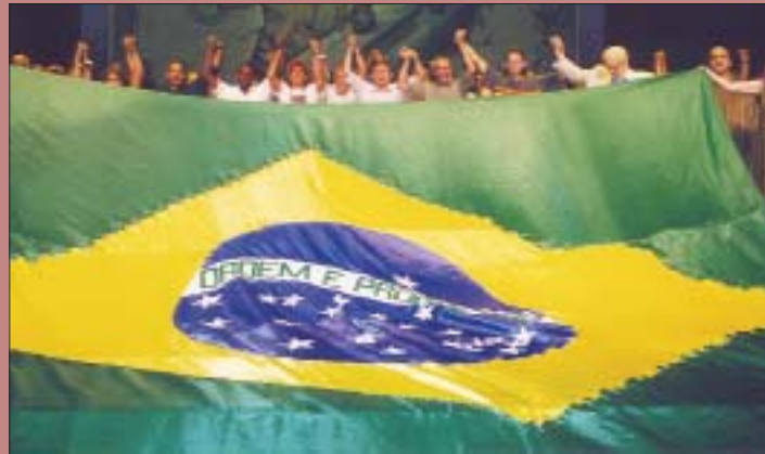
"Tribunal da Dívida Externa", Brasil, 1999 "External Debt Tribunal", Brazil, 1999

O Testemunho revelado neste livro indica, mais que tudo, o trilhar de processos comuns. Assim se quer expressar o Fórum Ecumênico Brasil : a partir da síntese dos principais focos de sua reflexão conjunta, tanto nos diálogos diversos em que está coletivamente inserido, como naqueles em que seus integrantes estão bilateralmente envolvidos.