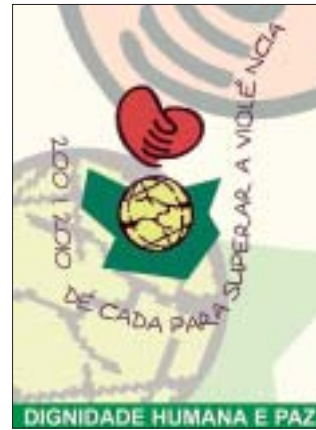
“Década Ecumênica para Superar a Violência” “Ecumenical Decade to Overcome Violence”

A campanha “Década Ecumênica para Superar a Violência”, no Brasil, tem como objetivo colocar a preocupação e o esforço de superar a violência e de