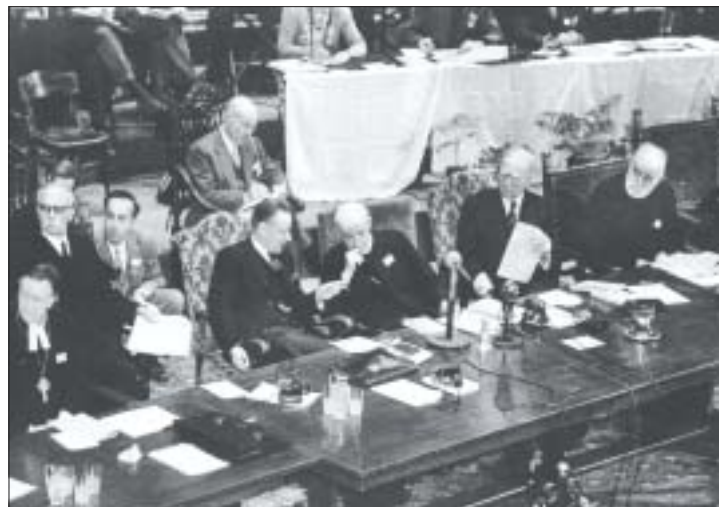
CMI, Amsterdam, 1948 WCC, Amsterdam, 1948