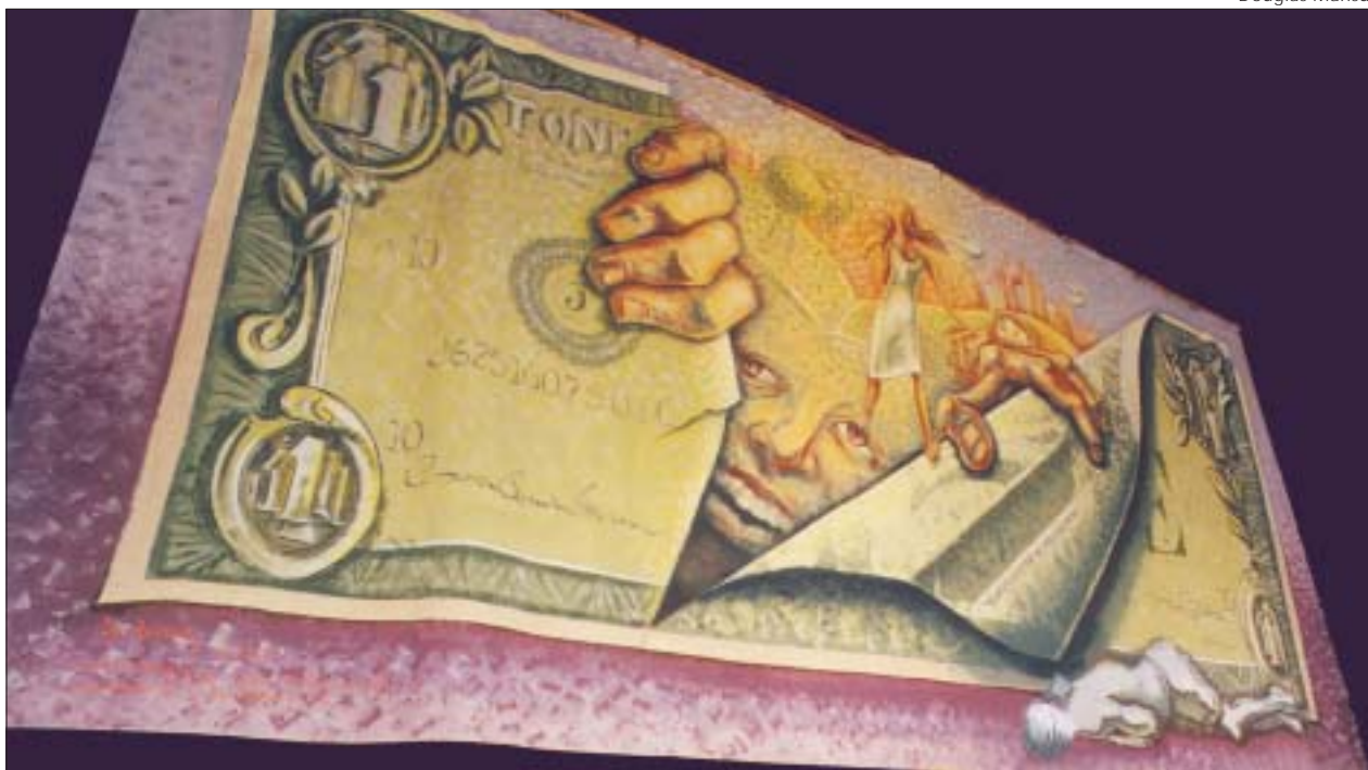
"Tribunal da Dívida Externa", Brasil, 1999 "External Debt Tribunal", Brazil, 1999

também abordado adiante, de promoção da reflexão sobre "Missão e Cooperação".