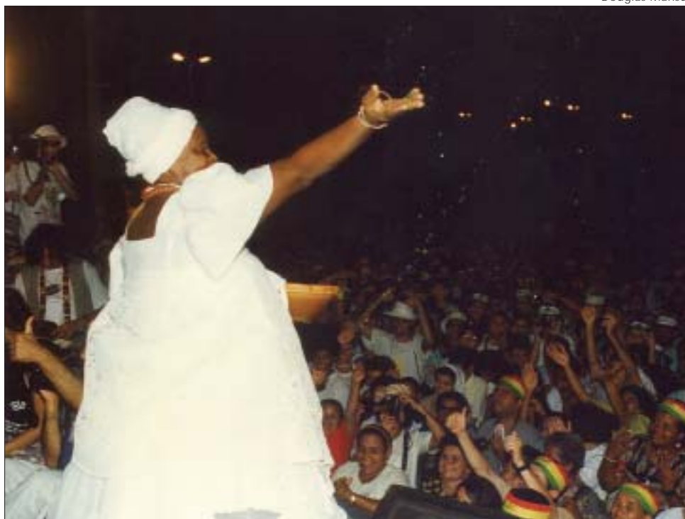
"X Intereclesial de CEBs", Brasil, 2000 "X National Meeting of Christian Base Communities", Brazil, 2000