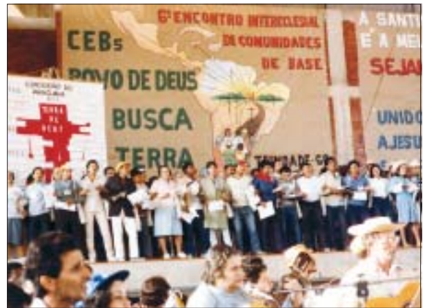
"VI Intereclesial de CEBs", Brazil, 1986 "VI National Meeting of Christian Base Communities" Brazil, 1986