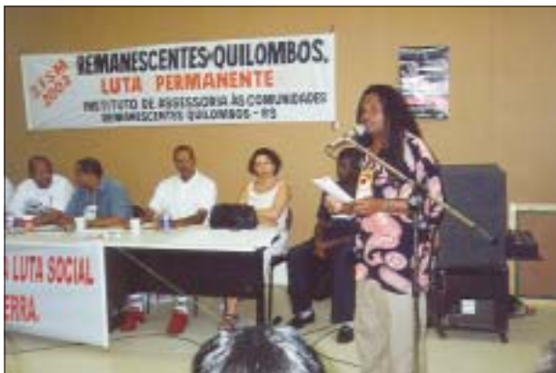
"II Fórum Social Mundial", 2002 – Direitos dos negros "II World Social Forum", 2002 – Black people's rights

O FE-Brasil, a partir daquele ano, assumiu um papel importante nas articulações da família ecumênica organizando, pela primeira vez, uma Coalizão