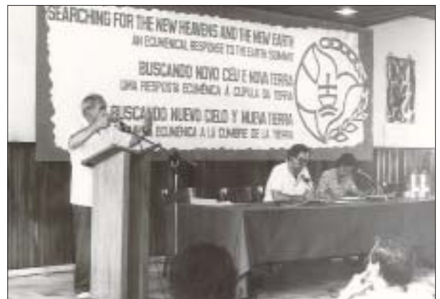
Conferência ecumênica durante a “Eco-92” Ecumenical conference during the “UN Eco-92”

This situation of Rights violation is exactly what has caused the emergence of a new international civil consciousness. It may be identified with a two-