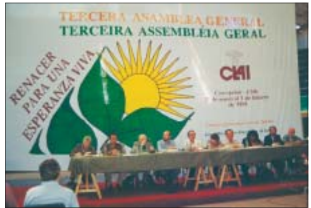
III Assembléia do Clai Clai's III Assembly

Em 1999, depois da “8ª assembléia do CMI” em Harare, Zimbábue, o Conselho Mundial de Igrejas e o Conselho Latino-Americano de Igrejas se reúnem e, após revisarem o papel até então desenvolvido pelo Grupo Regional do Compartilhar Ecumênico de Recursos , procuram reformular seus objetivos, sua dinâmica de operação e sua composição. Desta iniciativa de ambos os Conselhos surge, então, o Fórum Regional do Compartilhar Ecumênico de Recursos (Focer), que inaugura suas atividades em 2000. Nesta nova configuração, o CER-AL encerra sua relação unilateral com o CMI ao incorporar novos protagonistas na sua condução. Esta nova estrutura do Compartilhar Ecumênico