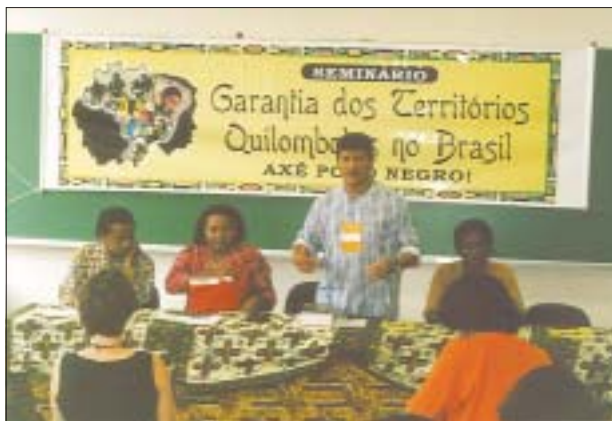
“III Fórum Social Mundial”, 2003 – Direitos dos negros “III World Social Forum”, 2003 – Black people's rights

There is growing evidence that the model of these actions, at the local, national, and international levels, does not respond to the aging of the social movements built upon the capital-labor dialectics. Nevertheless, the capital-labor contradiction persists. However, there are new, more complex aspects and issues emerging. For example, there is an increasing awareness of the moratorium imposed by Capital: the ecological moratorium, the cultural and religious diversity moratorium, and the ethnical, gender, and generational moratorium. They have generated new agendas for the social struggles that now demand more quality of life, more happiness. Ultimately these are ethical-political-spiritual values. They have to respond to the need for care and reciprocity. Let us affirm: there is a demand for an ideological and civilizational revolution. We can say that the demand is for compliance with “modern values