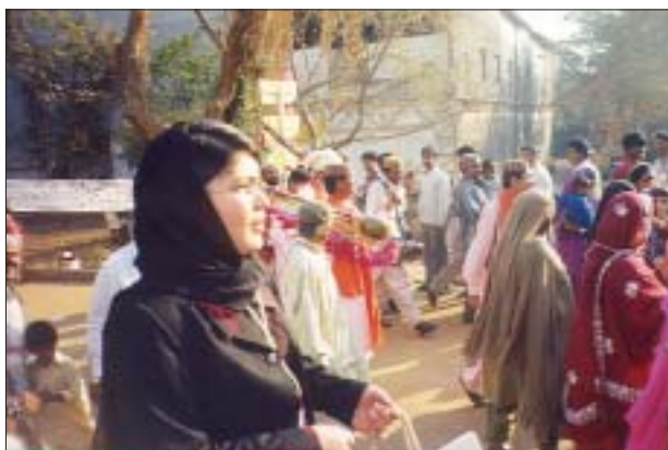
“IV Fórum Social Mundial”, Índia, 2004 “IV World Social Forum”, India, 2004

One of the highlights in this context of participation in the PAD, the “Consultation: Democratization and Construction of Peace”, held in 2004, was promoted by the PAD, FE-Brazil, Cese and Icco (Dutch ecumenical agency of cooperation for the development). Pressing themes from the Brazilian reality were brought up to this consultation, related to both inequality and social discrimination in the country. An analysis of the root causes of violence and discrimination was of fundamental importance, as was the status of the economic issue, in order to