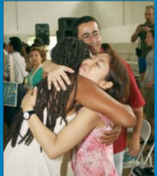
"3ª Jornada Ecológica", Brasil, 2005 "3rd Ecumenical Gathering, ", Brazil, 2005