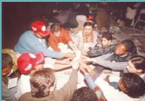
"2ª Jornada Ecumênica", Brasil, 2002