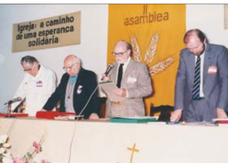
Assembléia do Clai Clai Assembly

After the "8 th Assembly", held in 1998, in Harare, Zimbabwe, and within the framework of a new structure of self-understanding of the World Council of Churches , the then recently established Commission for Regional Relations focused its activities upon the knowledge and experience accumulated in the process of Ecumenical Sharing of Resources ,