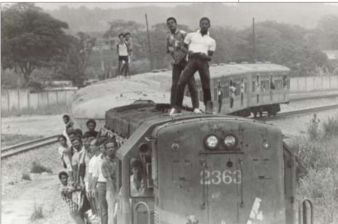
Surfistas de trem no Rio de Janeiro, década de 1990

SIXTH THESIS: The vital notion of solidarity must be recovered. Human beings do not have spontaneous