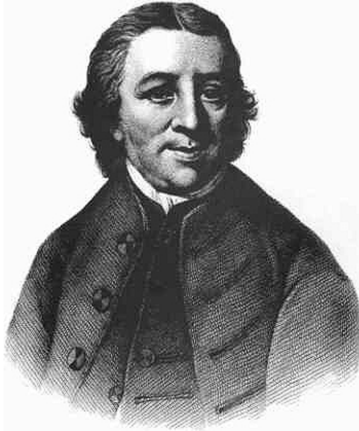
PETER BÖHLER BISPO DA IGREJA DOS IRMÃOS MORÁVIOS