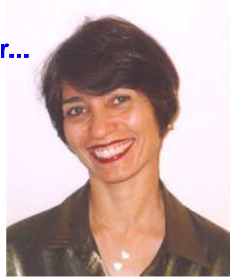
Por Marisa Ferreira Episcopisa da REMNE

Que Deus nos abençoe. E que tenhamos um bom Dia Internacional da Mulher e de toda a humanidade. É isto que as mulheres desejam.